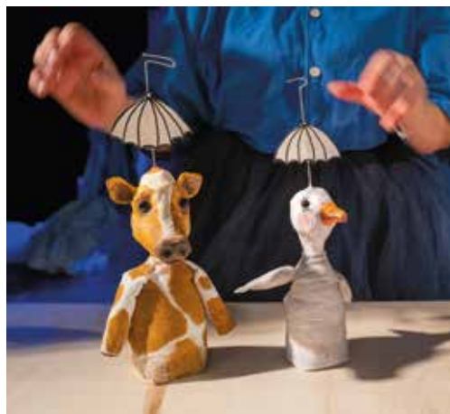
Tout est bien qui finit bien (Compagnie Sur Le Fil)

Au fil des ans, l'expression marionnettique prend une place de choix dans les arts de la scène. Ce focus fut l'occasion de montrer ceux et celles qui, parmi nos résident.e.s, ont choisi ce mode d'expression pour véhiculer leur créativité.